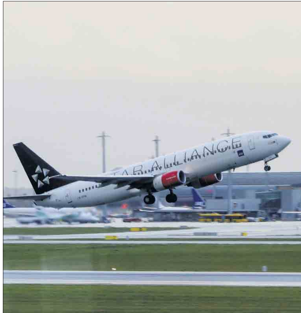
RULL INN PLANEN: Det er galskap å satse på en tredje rullebane på Gardermoen, slik Avinor nå gjør, skriver Frans-Jan Parmentier.

Gardermoen når kapasitetsgrensa, særlig i rushtida, og en tredje rullebane vil kunne avlaste. Men tre av ti reisende, både i rushen og ellers, flyr på bare fem ruter. Hvert år flyr 8,5 millioner passasjerer fra og til Trondheim, Bergen, Stavanger, København og Stockholm. Jeg synes også at det er viktig med gode forbindelser til disse byene, men i luftlinje er det under 500 kilometer til hver av dem. Nordmenn flyr allerede nå mest innenlands av alle europeere – fire ganger så ofte som svenskene, nummer to på lista. Innenlandsreising må da kunne gjøres annerledes?